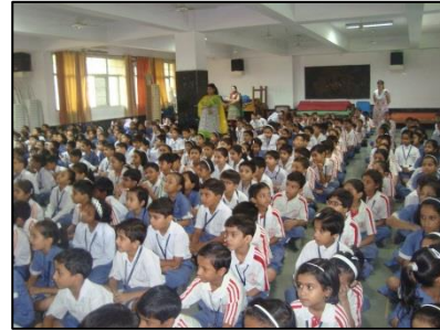
Una de las estudiantes en la Escuela DAV Pushpanjali en India promocionando su empresa "Stand Tall" durante la asamblea.