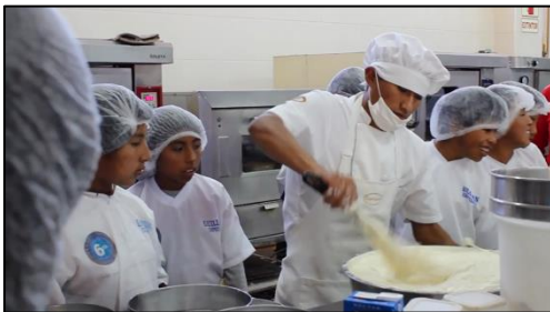
El equipo de Qallarikuy aprendiendo sobre el proceso productivo de las mermeladas.

Los estudiantes visitaron primero ‘Capriccio’, una empresa que los capacitó en cómo hacer mermeladas. Luego visitaron ‘Laboratorios Portugal’, quienes les enseñaron cómo hacer ungüentos y la importancia de tener buenas prácticas sanitarias durante el proceso productivo. Desde entonces, han estado llevando adelante exitosamente su empresa de mermeladas y ungüentos (‘Qallarikuy’) y fueron los ganadores Regionales de Latinoamérica en el Concurso Escuela Emprendedora 2013.