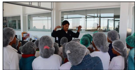
Estudiantes escuchando a uno de los expertos de la empresa en la producción de ungüentos.