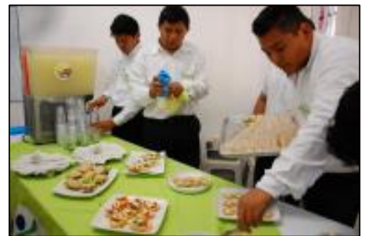
Miembros del equipo YUCADN preparando sus productos para degustación

Los estudiantes mencionaron en su Informe Anual que en general aprendieron a ser tolerantes en situaciones donde la creatividad, flexibilidad, habilidades de conocimiento y actitudes positivas fueron requeridas.