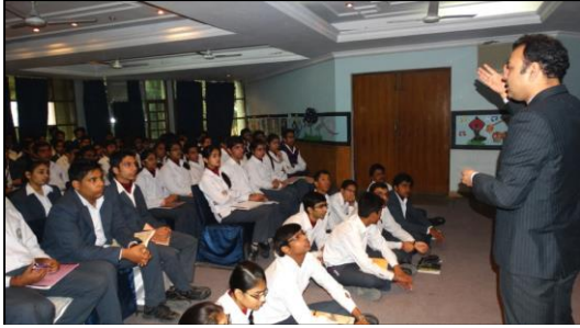
Estudiantes de la Escuela KIIT World escuchando a un prominente empresario local.

Por ejemplo la Escuela KIIT World en India invitó a un empresario local que realizó sesiones interactivas con los estudiantes con el tema ‘Qué se debe considerar en la creación de un empresario exitoso’, ‘El emprendimiento como una opción profesional emergente’ y ‘Dinámica Empresarial’. Los estudiantes de la escuela KIIT World consideraron que estos talleres introdujeron nuevos conceptos y los ayudaron a hacer planes para el futuro.