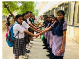
Iniciativa Escuelas Unidas