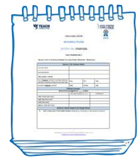
PLANTILLAS DE ENTREGA