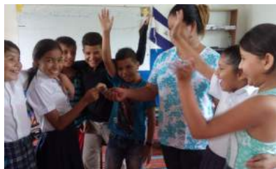
Semana Global del Emprendimiento