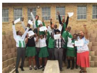
Mini-Competencia de Fotos